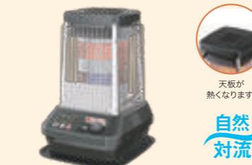
メタリックグレー(H) JANコード:4951272 025474