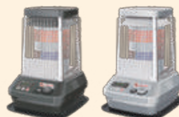
メタリックグレー(H) JANコード:4951272 025467 プラチナシルバー(S) JANコード:4951272 025450