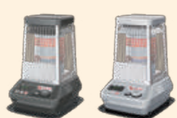
メタリックグレー(H) JANコード:4951272 025443 プラチナシルバー(S) JANコード:4951272 025436