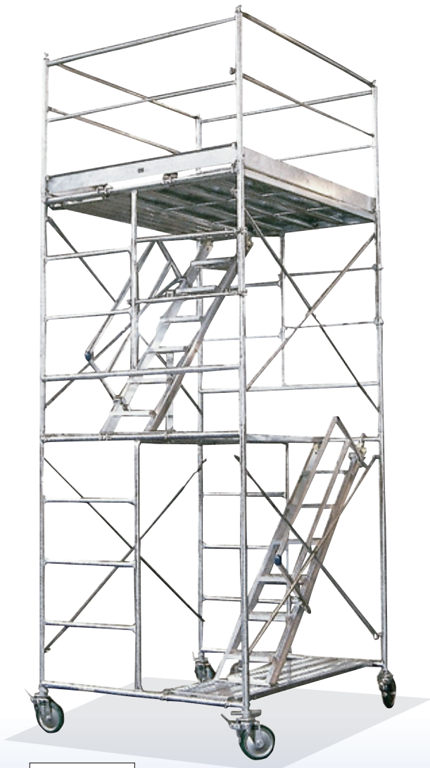
内階段式 2 段