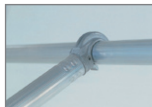
オートロックフックジョイントで組立・解体も簡単。