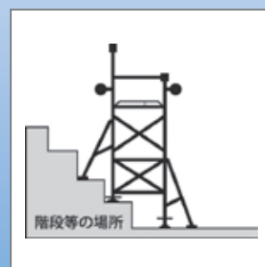
平地以外の段差がある場所にも設置できます。あらゆる作業に合わせてお使いください。