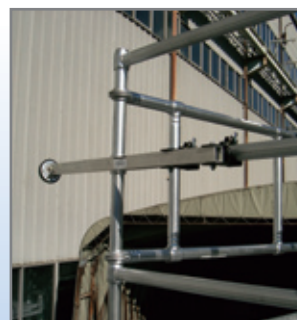
標準タイプ同様に壁当てでも使用できます。