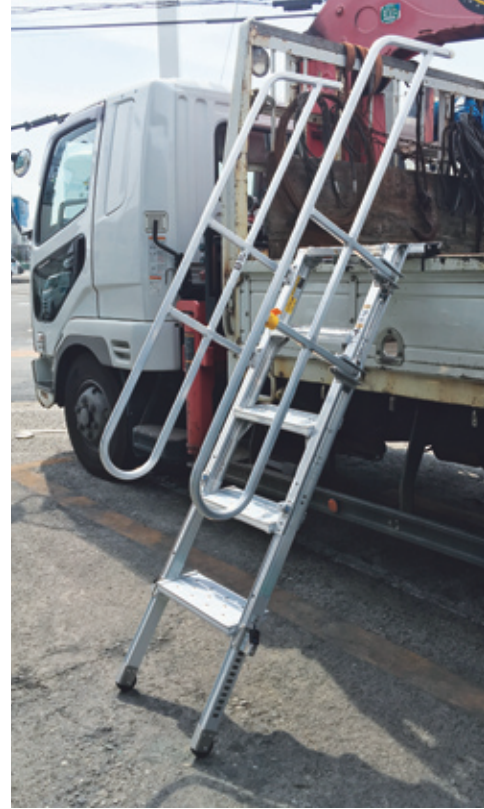
1t～10tトラックまで使用可能！ (車種・形状・使用条件によって設置できない場合もあります)